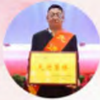
宁夏上陵牧业股份有限公司