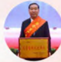
固原新时代购物中心(有限公司)