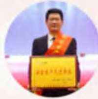
宁夏上陵房地产开发有限公司