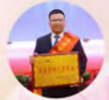
宁夏银川上陵雷克萨斯汽车销售服务有限公司