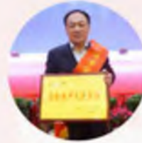
宁夏赐鑫建筑工程有限公司